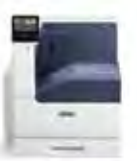
Imprimante couleur Xerox® VersaLink® C7000