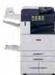
Imprimante multifonctions Xerox® AltaLink® B8145/B8155 /B8170

Pour en savoir plus sur la technologie Xerox® ConnectKey, rendez-vous sur www.ConnectKey.com .