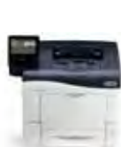
Imprimante couleur Xerox® VersaLink® C400