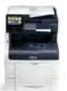
Imprimante multifonctions couleur Xerox® VersaLink® C405