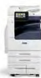
Imprimante multifonctions Xerox® VersaLink® B7025/ B7030/B7035