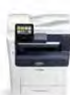
Imprimante multifonctions Xerox® VersaLink® B405