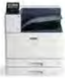
Imprimante couleur Xerox® VersaLink® C8000