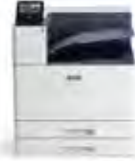
Imprimante couleur Xerox® VersaLink® C9000