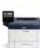
Imprimante Xerox® VersaLink® B400