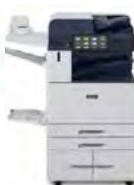
Imprimante multifonctions couleur Xerox® AltaLink® C8130/ C8135/C8145/ C8155/C8170