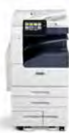
Imprimante multifonctions couleur Xerox® VersaLink® C7020/ C7025/C7030